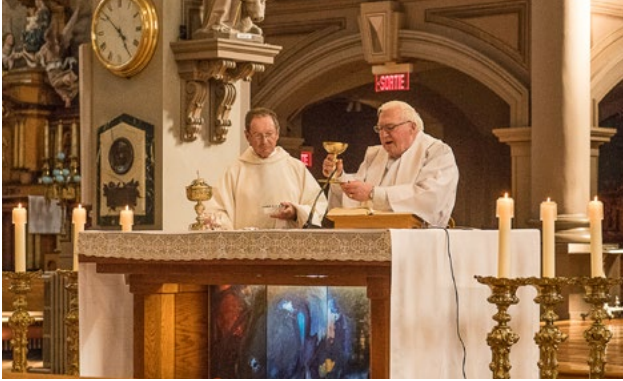
La messe des Anciens au Gesu