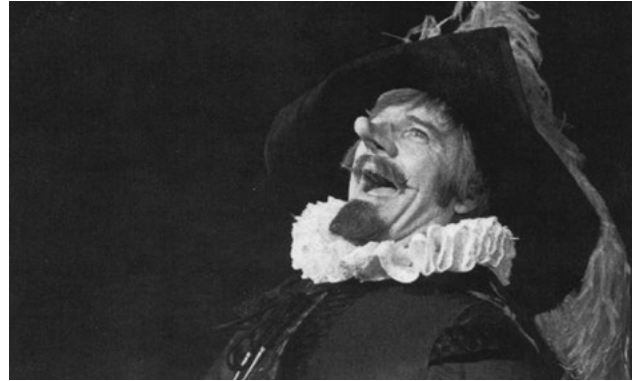
Gilles Pelletier à la NCT, Cyrano de Bergerac, 1974