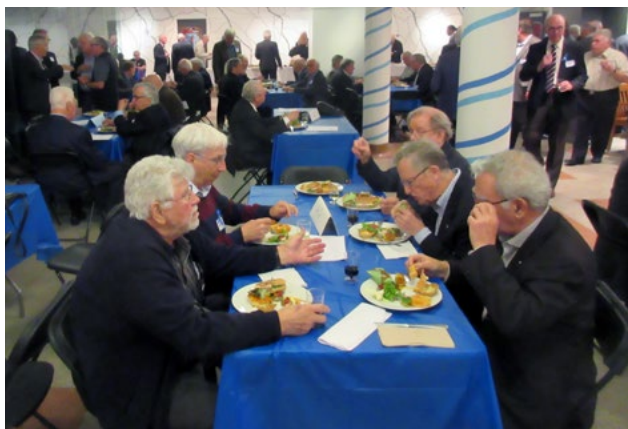
La réception dans le Hall du Gesù