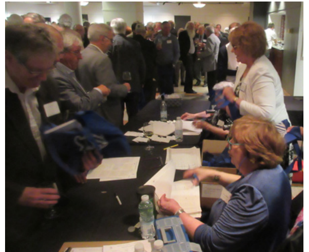
Effervescence à la table de distribution des deux publications lancées le soir du gala.