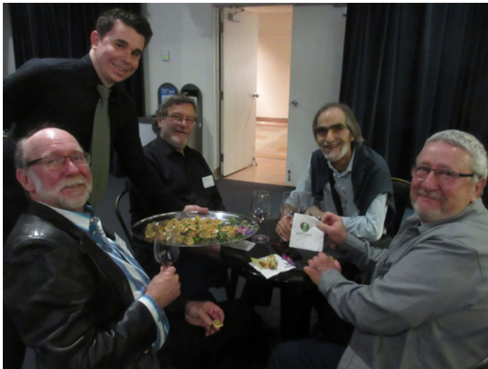
C'est l'heure du cocktail.