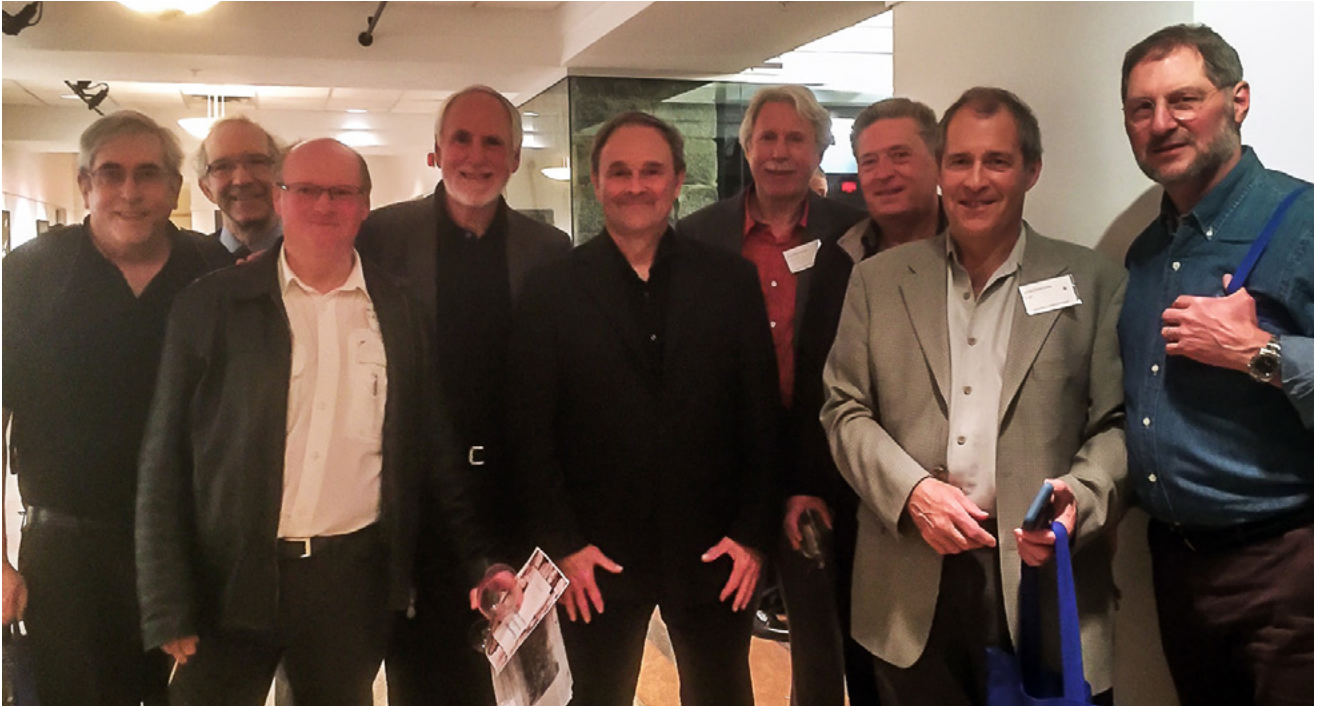
Quelques anciens des conventums 68, 69 et 70 prenant la pose.