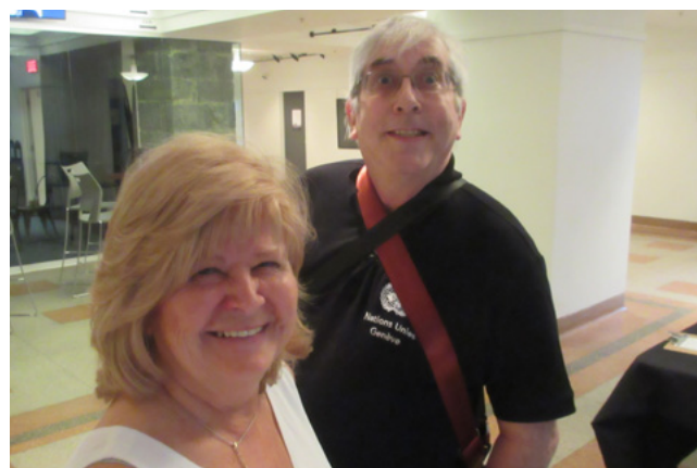
La coordonnatrice, Suzanne Boyd, et le photographe, Daniel Gratton, fébriles avant le début de la soirée.