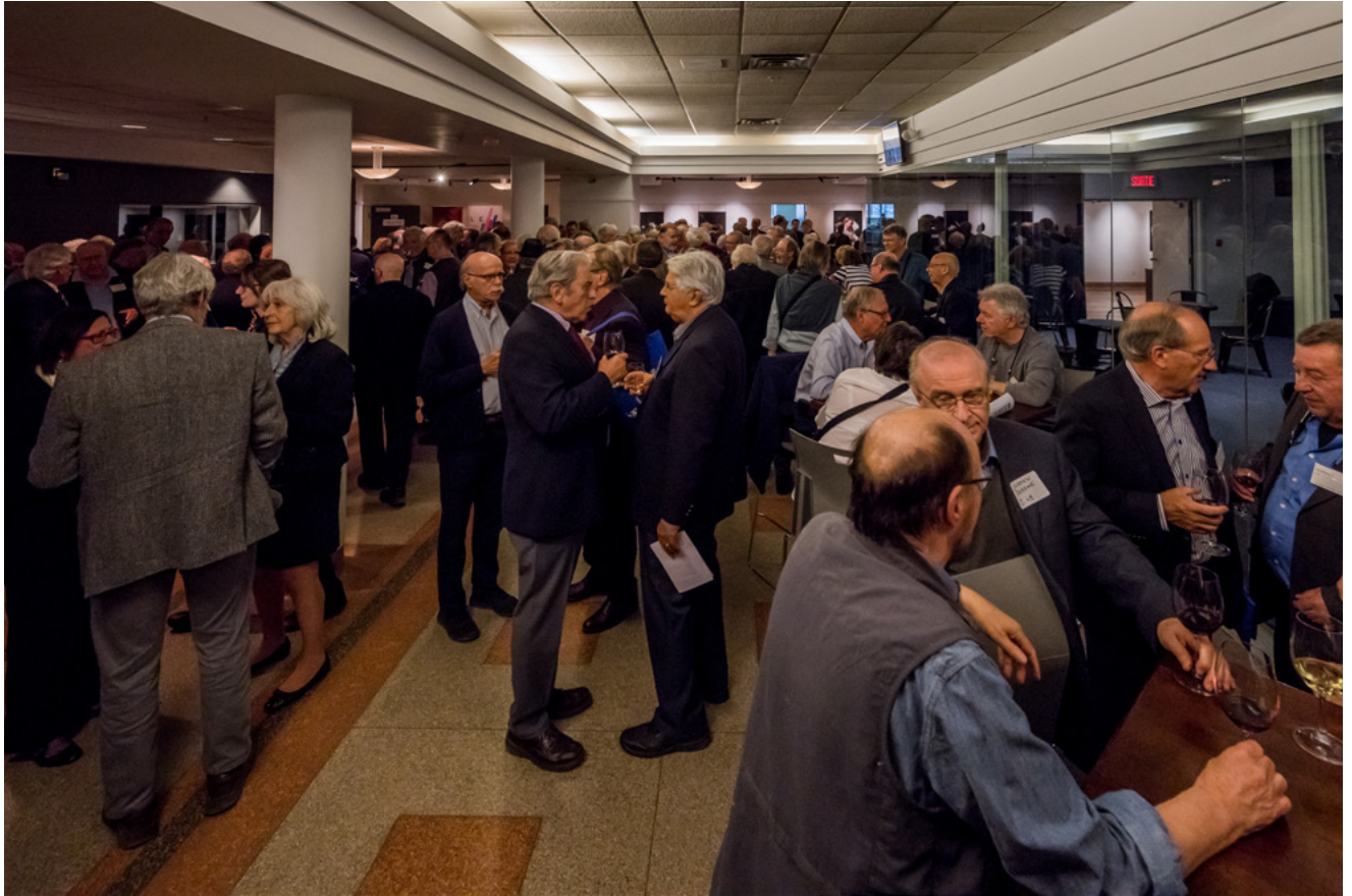
Vue d'ensemble du cocktail dans le hall du Gesù.