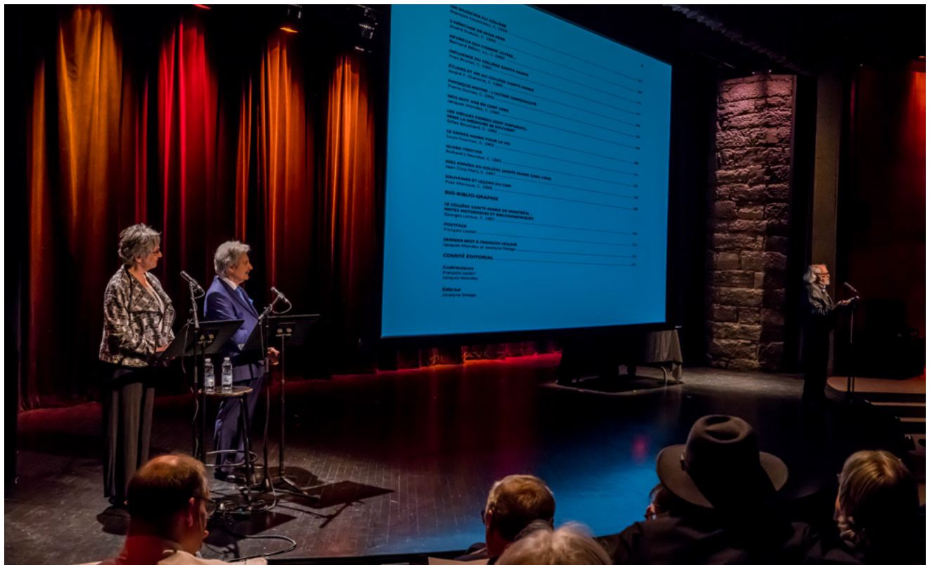
Vue d'ensemble de la scène du Gesù. À l'écran, la table des matières du livre de Témoignages.