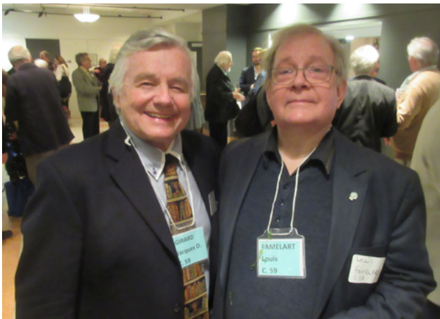
De souriants convives du conventum 59.