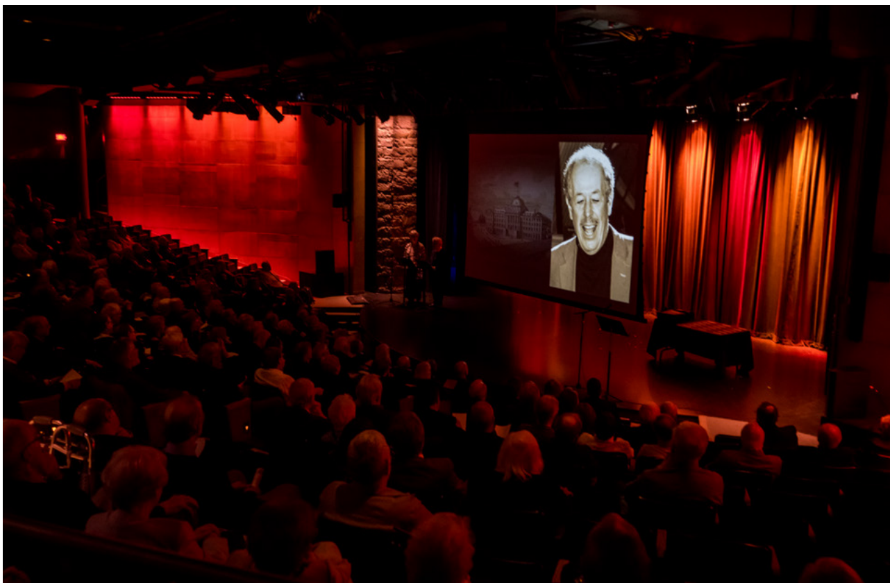
Présentations des lauréats. À l'écran, Denys Arcand.