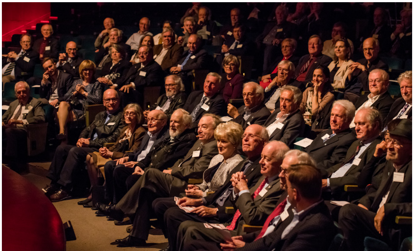
Dans les premières rangées de la salle, les auteurs présents et leurs invités, et quelques-uns des lauréats.